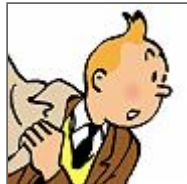
AP / Herge / Moulinsart